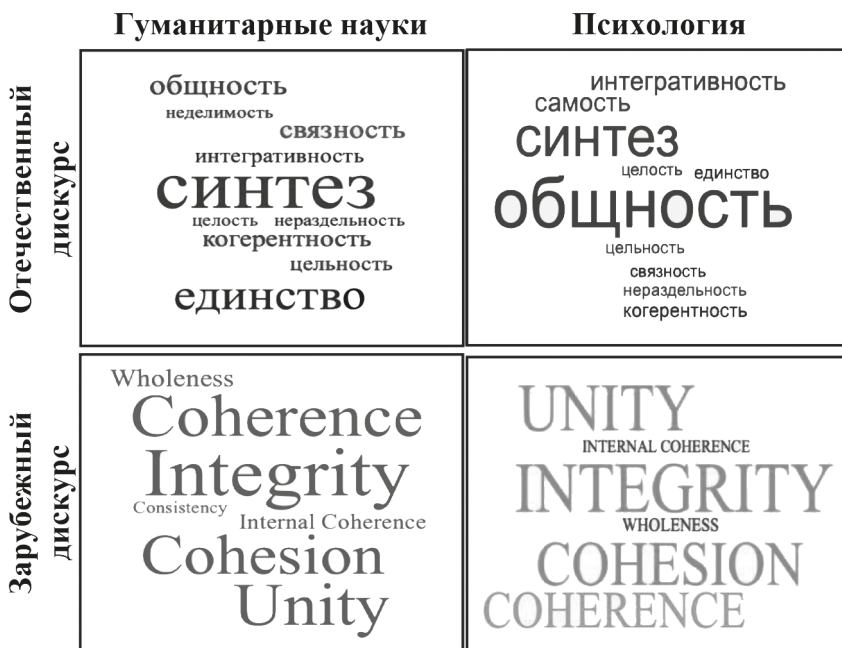
Рис. 2. Теговые облака на основе частотного анализа упоминания в гуманитарном и психологическом отечественном и зарубежном научном дискурсе понятий, раскрывающих проблематику целостности

При этом содержательное раскрытие принципа целостности в российском гуманитарном знании больше ориентировано на идею синтеза, а в англоязычном сегменте — на интегративность и согласованность (рис. 2). В отличие от гуманитарного дискурса, отечественная психология для описания целостности опирается на понятие общности, что близко к значениям интегративности ( integrity ) и единства ( unity ) в зарубежной психологии, а также связности ( cohesion ) для раскрытия внутреннего единства (неразобщенности) разных подсистем и элементов системы личности.