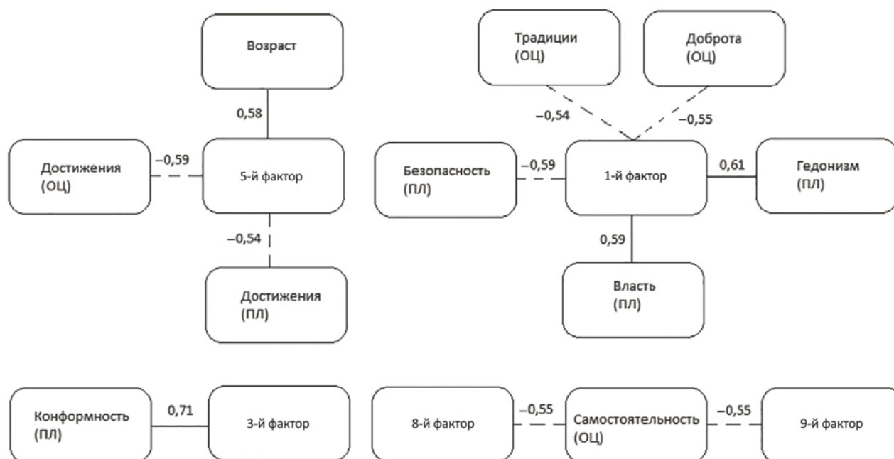
Рис. 2. Корреляционная плеяда взаимосвязей показателей жизненных ценностей личности и представлений о совести (группа грузинских испытуемых)